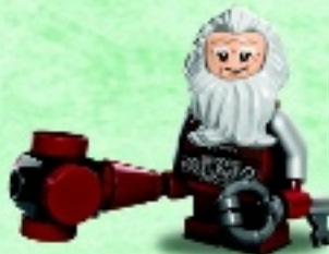
□ 79018 Balin the Dwarf Le nain Balin Balin el Enano