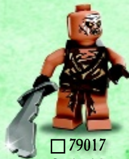
□ 79017 Gundabad Orc Orque de Gundabad Orco de Gundabad