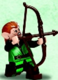
□ 79016 Tauriel™