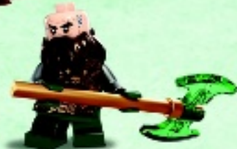
□ 79018 Dwalin the Dwarf Le nain Dwalin Dwalin el Enano