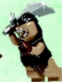
□ 79016 Hunter Orc Orque chasseur Orco Cazador