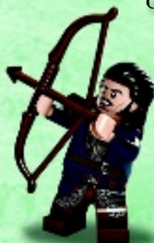
□ 79017 Bard the Bowman™