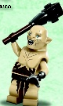
□ 79017 Azog™