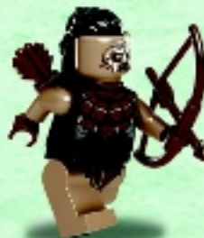
□ 79016 Hunter Orc Orque chasseur Orco Cazador