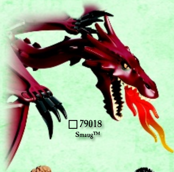
□ 79018 Smaug™