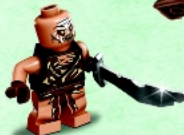
□ 79017 Gundabad Orc