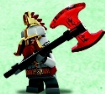
□ 79017 Dain Ironfoot Dain Pied d'Acier Dain Pie de Hierro