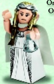
□ 79015 Galadriel™