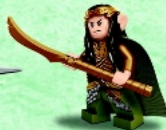
□ 79015 Elrond™