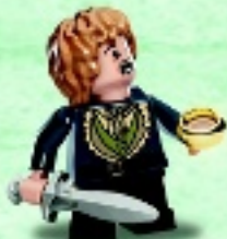
□ 79018 Bilbo Baggins™