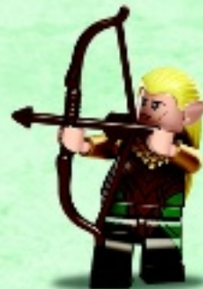
□ 79017 Legolas Greenleaf™