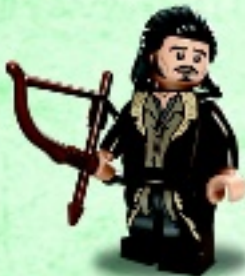
□ 79016 Bard the Bowman™