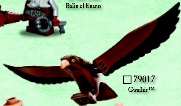
□ 79017 Gwaihir™