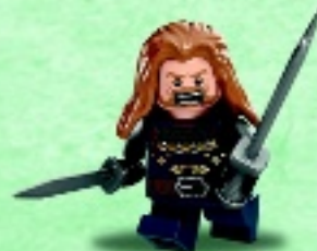
□ 79018 Fili the Dwarf Le nain Fili Fili el Enano