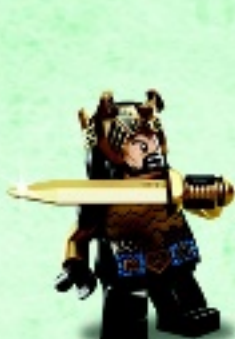
□ 79017 Thorin Oakenshield™