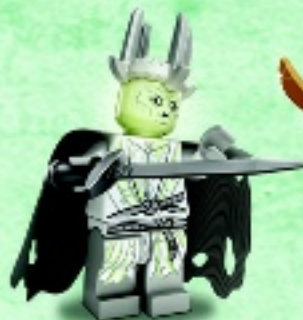
□ 79015 Witch-king Roi-Sorcier Rey Brujo