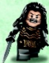
□ 79018 Kili the Dwarf Le nain Kili Kili el Enano