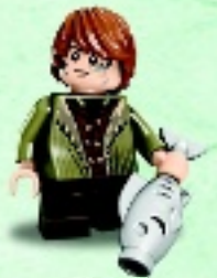
□ 79016 Bain son of Bard Bain fils de Bard Bain hijo de Bard